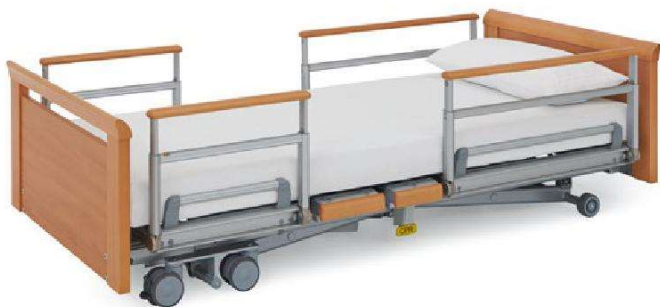
床型: 5384 Kepler